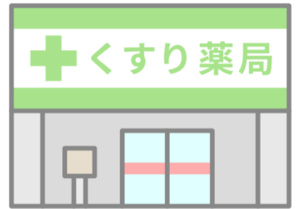
在宅訪問可能薬局リスト（賀茂薬剤師会）